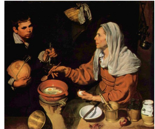
La vieja friendo huevos de Velásquez

tienden a ocultar o negar la situación por vergüenza, excesiva dignidad y rechazo a acusar a su propia descendencia y por ello prefieren autoinculparse, atribuyéndose haberlos educado mal y ser incapaces de oponerse a su "esclavitud admitida". Esto se conoce desde 2001 como "Síndrome de la abuela esclava".