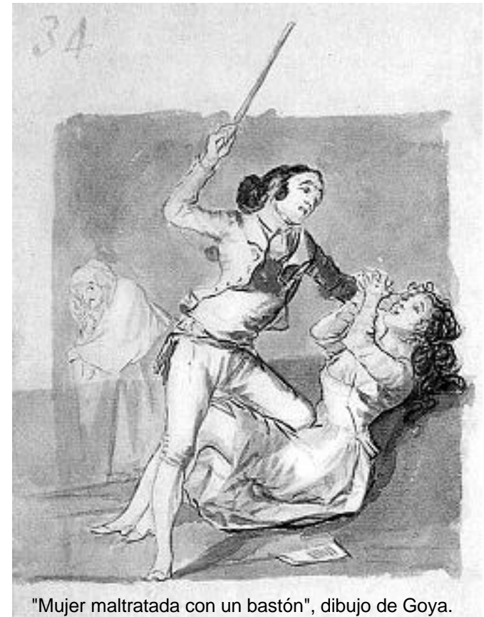
"Mujer maltratada con un bastón", dibujo de Goya.

Kofi Annan, Secretario General de las Naciones Unidas